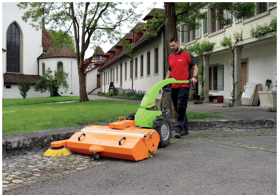
Resultat: freundlich einladende Sauberkeit