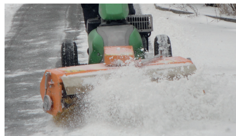
Kehren mit offenem System

Wird die Kombi-Kehrmaschine ohne Schmutzsammelbehälter eingesetzt, bürstet das offene System Staub, Schmutz oder Schnee nach vorne weg. Die seitlich gestellte Bürste befördert den Schmutz seitlich weg. Bei mehreren parallelen Arbeitsfahrten ist so auch ein Kehren von grösseren Plätzen ohne Schmutzsammelbehälter möglich.