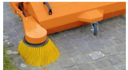
Seitenbesen für lückenlose Sauberkeit

Mit dem optional erhältlichen Seitenbesen lassen sich Hartplätze bis in letzte Ecken und Kanten hinein perfekt kehren. Der robuste und dennoch flexible Seitenbesen gleicht kleine Fahrspurfehler entlang von Randsteinen und Mauern dank seiner Flexibilität aus. Das Resultat sind bis aufs Detail sauber gekehrte Plätze.